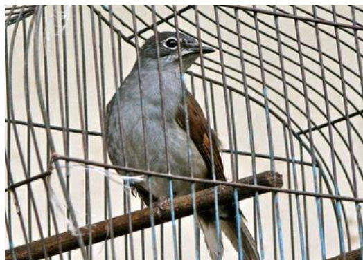
Figura 1: A bird in a cage