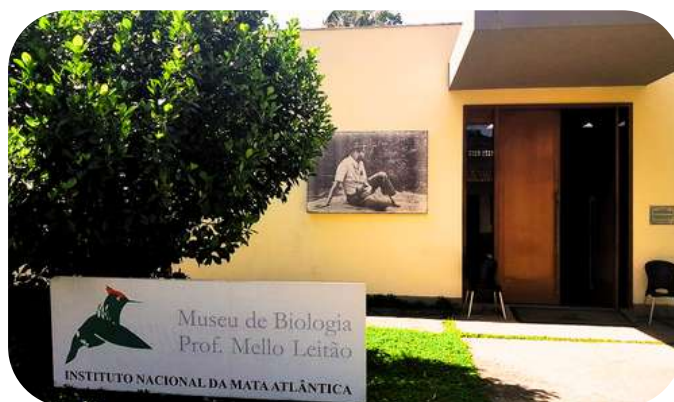
Museu de Biologia Prof. Mello Leitão.

Um local para relaxar, bonito, agradável, transmitindo uma paz, e a entrada é gratuita, visite com toda a família, vale.