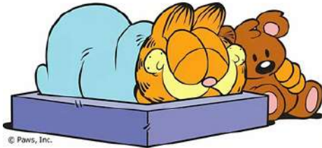
Disponível em: https://br.pinterest.com/pin/96968198221515415/ Acesso em: 01 abr. 2025.

Na frase "O gato está dormindo", o artigo "o" indica que estamos falando de um gato específico, possivelmente já conhecido pelas pessoas envolvidas na conversa.