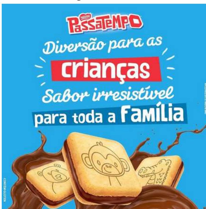
PASSATEMPO NESTLÉ. Passatempo . Instagram, 18 set. 2020. Disponível em: https://www.instagram.com/p/CFSGIS2hrUc/?utm_source=ig_web_copy_link&igsh=MzRIODBiNWFIZA== . Acesso em: 4 abr. 2025.