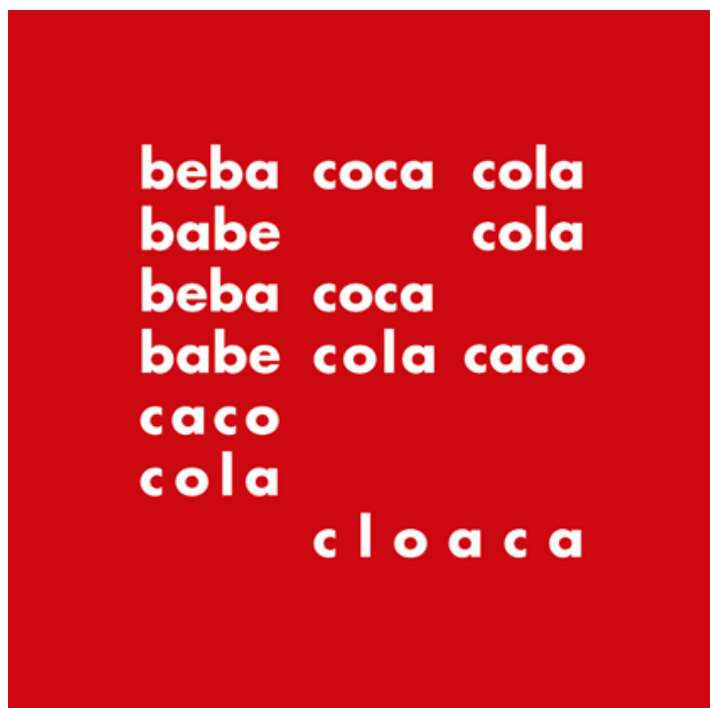
Décio Pignatari: beba coca-cola , 1957*

Leia o poema Beba coca-cola de Décio Pignatari.