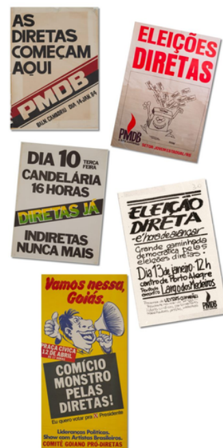
Cartazes de divulgação dos comícios do movimento Diretas Já!. Acervo Instituto Ulysses Guimarães.*

A poesia concreta, com sua busca pela inovação e sua capacidade de dialogar com o contexto social e político, ocupa um lugar de destaque nesse período e influenciou diversas tendências da poesia contemporânea. Assim, este material se concentrará em tratar dessa produção.