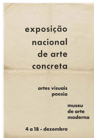
Cartaz de divulgação da exposição nacional de arte concreta .