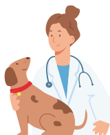
Imagem gerada pelo Canva

O cachorro está magro porque ficou doente.