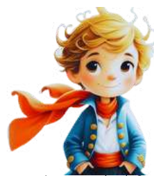
Imagem gerada pelo Canva