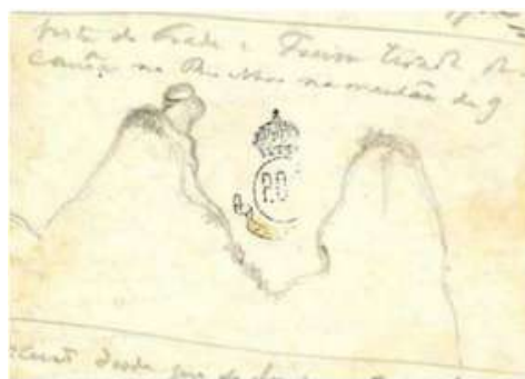
Em 1860, Dom Pedro II em visita ao Espírito Santo, desenhou um esboço da rocha.

No sul do Espírito Santo, em Itapemirim, fica localizado o Monte d'O Frade e a Freira, um famoso ponto do estado. De acordo com a lenda, os dois haviam dedicado a vida ao servir de Deus, porém se apaixonaram e não puderam se entregar ao romance.