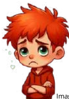
Imagem gerada pelo Canva