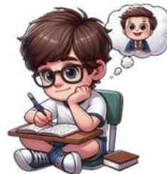
Imagem gerada pelo Canva