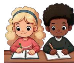
Imagem gerada pelo Canva