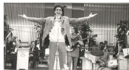
Caetano Veloso em apresentação do Festival de Música Brasileira, em 1967, no teatro Paramount - Foto: Domínio público/Acervo Arquivo Nacional**

Durante os anos 1960, o Brasil vivia sob um regime autoritário instaurado em 1964 com o golpe militar. A repressão política crescia, e manifestações culturais eram constantemente censuradas. Ao mesmo tempo, o mundo experimentava transformações marcadas pela juventude contestadora: o movimento hippie , o surgimento dos festivais de música , a contracultura e as revoluções sociais de 1968 .