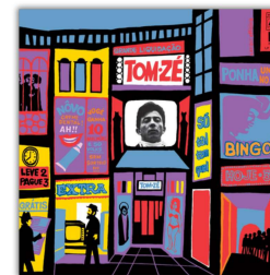
Capa do álbum Tom Zé (Rozenblit, 1968).**