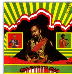
Capa do álbum Gilberto Gil (Philips, 1968).**