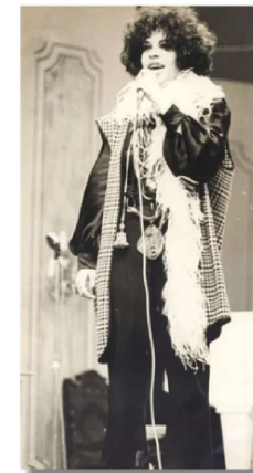
A cantora Gal Costa foi uma das vozes do tropicalismo. O visual dos artistas chocava os espectadores*

Além deles, o álbum Grande Liquidação , de Tom Zé, se destacou por trazer canções críticas ao consumismo e à vida urbana, enquanto Jorge Ben, mesmo sem se vincular de modo oficial ao movimento, dialogava com a estética tropicalista ao mesclar samba, soul, rock e psicodelia, especialmente no disco Jorge Ben (1969).