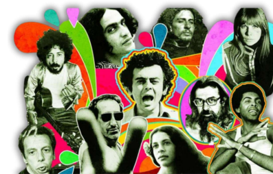
Reunião tropicalista. No alto, Caetano, Torquato Neto e Rita Lee; no meio, Tom Zé, Glauber Rocha, Rogério Duprat e Gil

Em um período marcado pela ditadura militar, os artistas tropicalistas usaram a arte como forma de crítica social e resistência política, utilizando de ironia , irreverência e experimentação estética para provocar reflexões sobre a identidade brasileira.