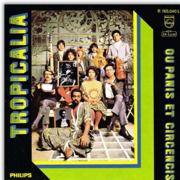
Capa de Tropicália ou Panis-et-Circenses - 1969*