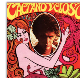
Capa do álbum Caetano Veloso (Philips, 1968).**

Esses álbuns demonstram como o Tropicalismo extrapolou os limites da música, tornando-se um movimento artístico e cultural de ruptura, invenção e resistência.