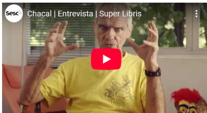
Vídeo: Chacal | Entrevista | Super Libris , no canal Sesc TV.

Para assistir ao vídeo leia o QR code ou clique aqui .