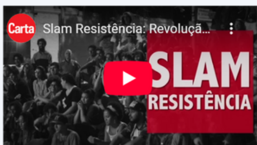
Slam Resistência: Revolução através da poesia. Vídeo produzido pela Carta Capital, com reportagem e imagens: Julia Leite e Yghor Boy edição: Yghor Boy.

Transformação social: a atuação de autores como Sérgio Vaz evidencia como a literatura pode ir além do entretenimento, tornando-se ferramenta de transformação social, educação e conscientização política, especialmente entre os jovens das periferias.