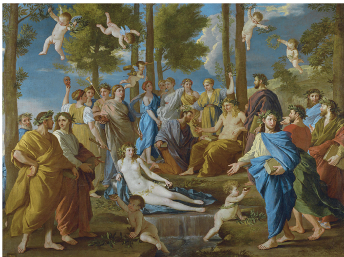
O Parnaso. Óleo sobre tela de Nicolas Poussin

O termo Parnasianismo foi inspirado simbolicamente no monte Parnaso , local sagrado da mitologia grega consagrado ao deus Apolo, patrono das artes e da poesia. Embora não tenha sido o berço literal do movimento, essa referência mitológica reforça a ligação da escola literária com os valores da Antiguidade Clássica - como a harmonia, o equilíbrio e o ideal de perfeição formal - que orientaram os poetas parnasianos em sua produção estética.