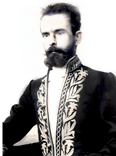
Retrato de Raimundo Correia.