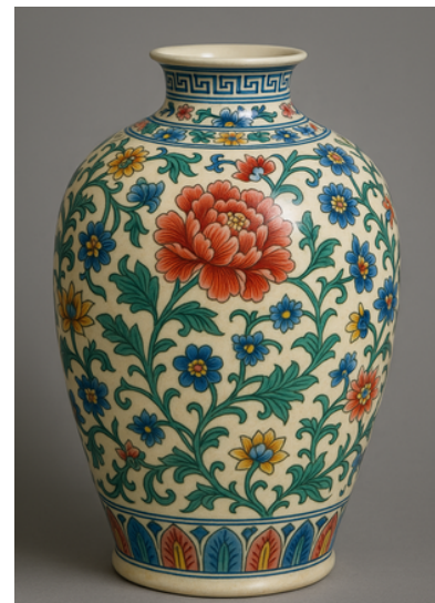
Imagem de vaso chinês. [inteligência artificial]. OPENAI. Disponível em ChatGPT, 11 jun. 2025.

chim : termo antigo e raro para se referir a um chinês, usado de forma poética no contexto.