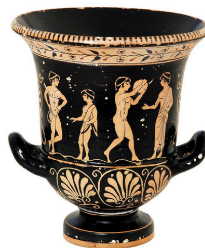
Vaso grego . [fotografia]. WikimediaImages. Pixabay. Disponível em: https://pixabay.com/pt/photos/grego-vaso-r%C3%A9plica-2202222/ . Acesso em 10 jun. 2025.

OLIVEIRA, A. Vaso grego . disponível em: https://literaturabrasileira.ufsc.br/documentos/?action=download&id=138766 . Acesso em: 10 jun. 2025.