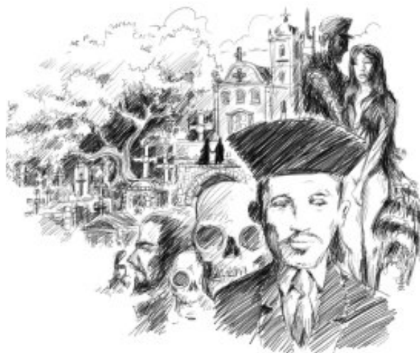
Ilustração do poema Versos Íntimos . Disponível em:

https://humbertodealmeida.com.br/essa-pantera-chamada-ingratidao-do-augusto-dos-anjos/ . Acesso em: 25 de jun. 2025.