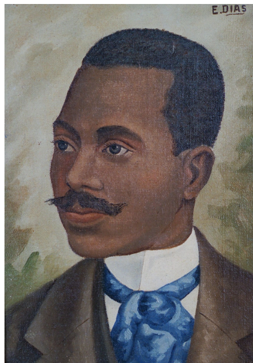
Retrato de Cruz e Souza. Pintura em óleo. MASC-SC. Disponível em: https://aplicacoes.fcc.sc.gov.br/wp/masc/acer/vo/retrato-de-cruz-e-souza/ . Acesso em: 24 de jun. 2025.

Leia a seguir um trecho do poema Antífonas , de Cruz e Souza, retirado de sua obra Broquéis :