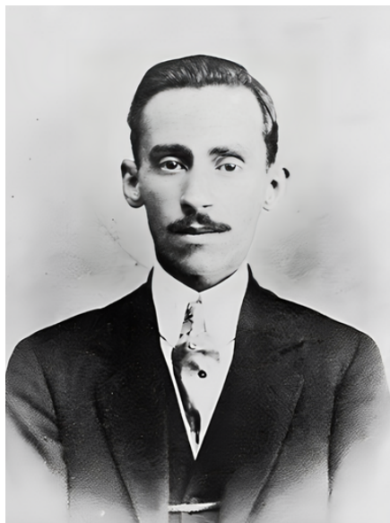
Retrato de Augusto dos Anjos.