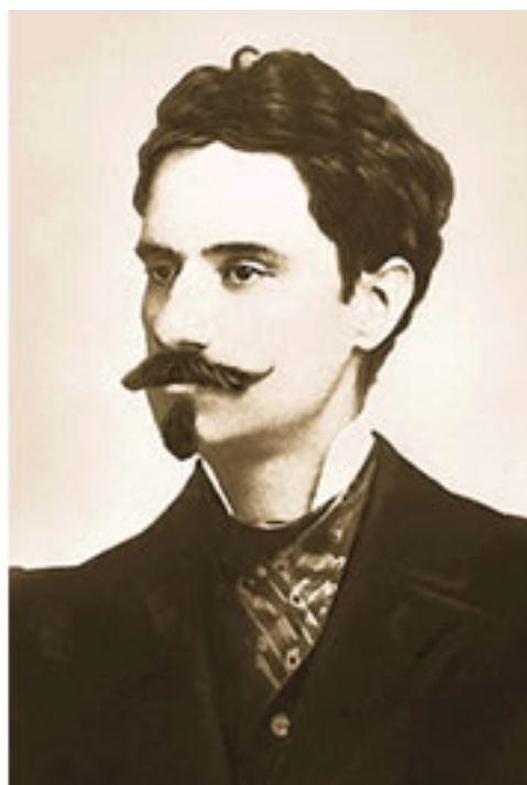
Retrato de Alphonsus de Guimaraens .

Sua estreia na Literatura ocorreu em 1899 , com os livros de poemas Setenário das Dores de Nossa Senhora , Câmara Ardente e Dona Mística . No entanto, a consolidação de sua voz simbolista deu-se com a publicação de Kiriale , obra que editou por conta própria em 1902 .