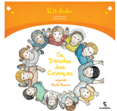
Imagem disponível em: https://www.moderna.com.br/literatura/livro/os-direitos-das-criancas-segundo-ruth-rocha-1 . Acesso em 23.07.2025.

ROCHA, Ruth. Os direitos das crianças: segundo Ruth Rocha.