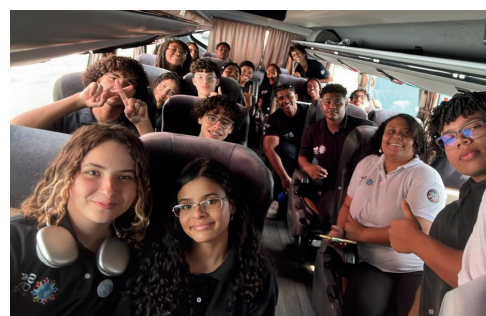
Estudantes da EEEM Mário Gurgel