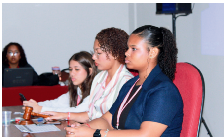
Mesa diretora do comitê CSW