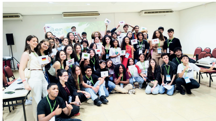
Encerramento do comitê COP-30

A fiscalização será feita através de drones, satélites e tecnologias, facilitando o controle dessas áreas.