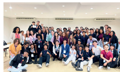
Encerramento do comitê Racismo no Esporte

Enquanto o comitê tentava entrar em consenso para a resolução das pautas, o presidente do time