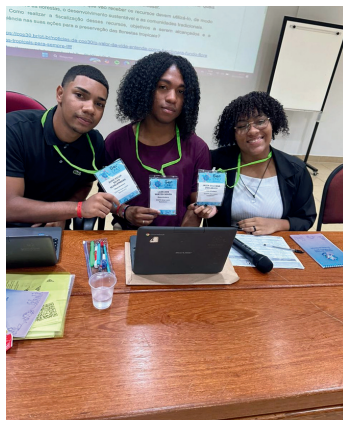
Mesa diretora no comitê COP-30

Apesar das claras tensões presente no comitê, os delegados entraram em consenso com a proposta de